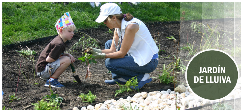
Por encima, un estudiante aprende sobre el jardín de lluvia instalado en su patio de la escuela.

Las aguas pluviales deben ser manejadas antes de que llegue al alcantarillado pluvial. Los jardines de lluvia, barriles de lluvia y techos verdes (llamado infraestructura verde) pueden capturar agua de lluvia para que pueda ser reutilizado y absorbido en el suelo. ¡La mejor parte de la infraestructura verde es que no sólo ayuda a manejar las aguas pluviales pero también hace las comunidades se vean más bonitas!