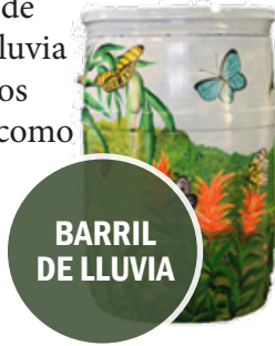
BARRIL DE LLUVIA

Los barriles de lluvia se conectan al tubo de bajada de un canalón y recogen agua de lluvia para ser utilizado más tarde para regar. Los barriles de lluvia pueden ser tan simples como un barril de basura, barril de plástico, ó una cubeta de madera que puede ser decorado con pintura.