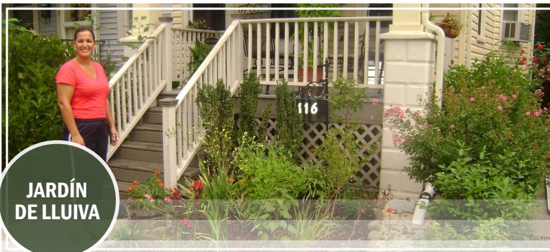
JARDÍN DE LLUVIA

Abajo, una dueña de casa con un hermoso jardín de lluvia.