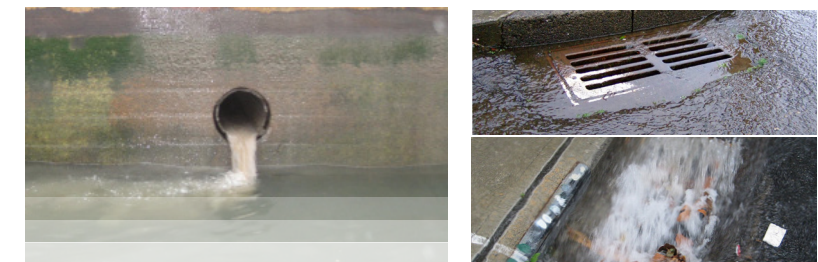
Abajo, izquierda: desbordamiento de alcantarillado combinado se libera en un canal local de Nueva Jersey, a la derecha: arriba, las aguas pluviales se apresura a unas aguas pluviales y abajo, se desborda.

En Nueva Jersey, 21 municipios tienen sistemas de alcantarillado unitarios. En estas ciudades, hay un total de 217 sistemas de alcantarillado unitarios (NJDEP 2013) 1 . Cuando los sistemas se desbordan, las aguas pluviales que se han mezclado con aguas residuales sin tratamiento, descargan con múltiples contaminantes en las vías de aguas locales.